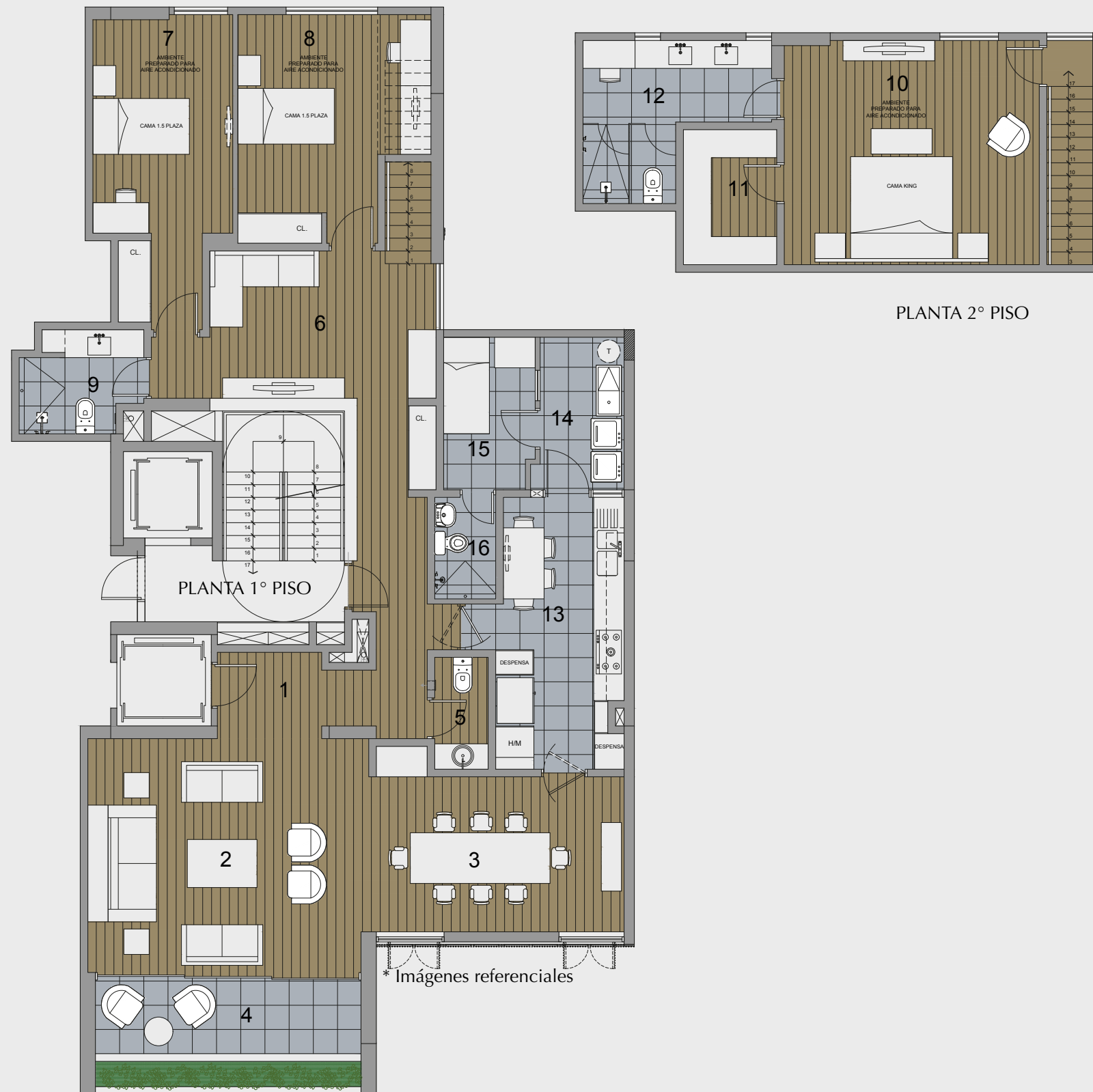
PLANTA 2° PISO